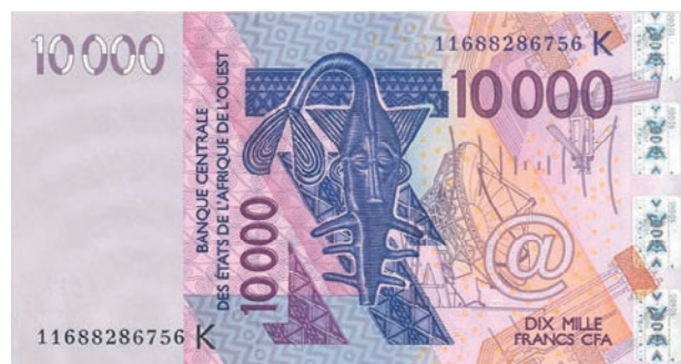
Billet de 10 000 francs CFA de la BCEAO.